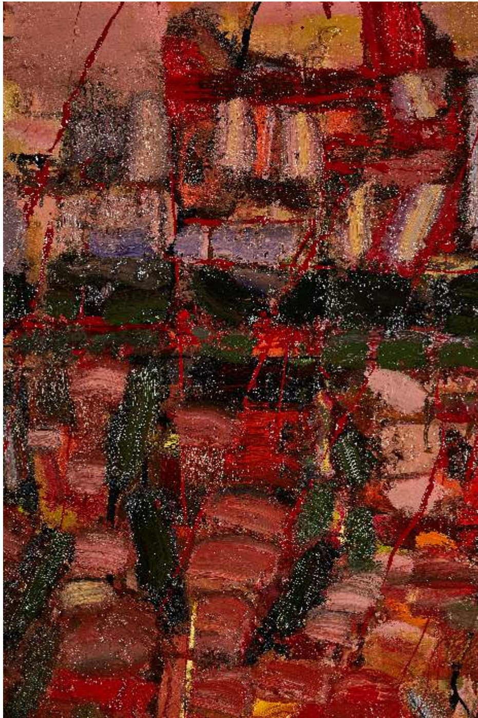
Common structure VI detail, olej plótno, 130 x 110cm, 2023