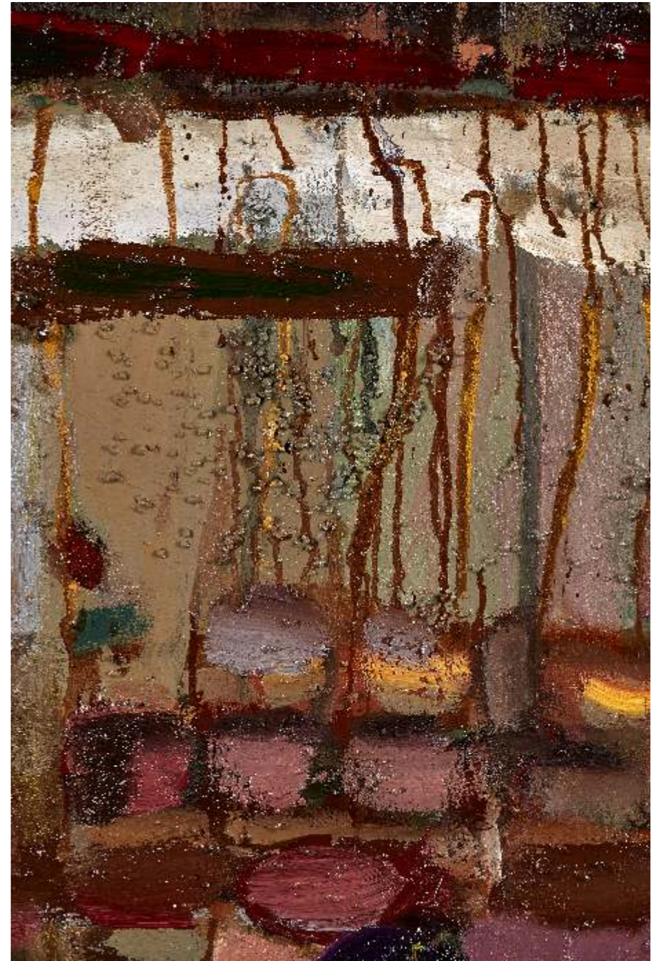
Common structure I detail 2, olej płótno, 130 x 110cm, 2023