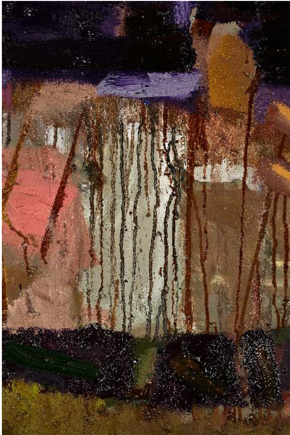
Common structure I detail, olej płótno, 130 x 110cm, 2023