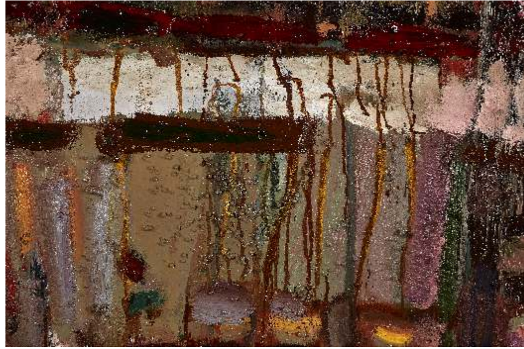
Common structure I detal 3, olej płótno, 130 x 110cm, 2023