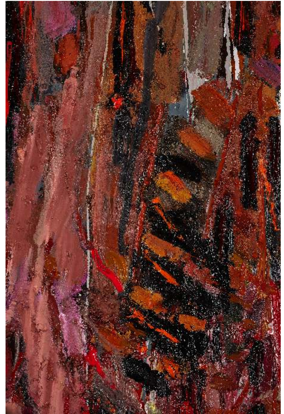
Autumn rythm II detail, olej plótno, 170 x 110cm