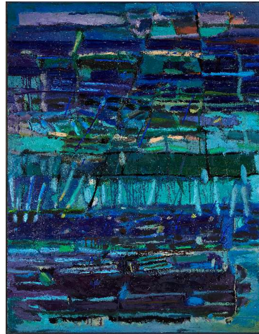
Błękitny rytm natury II, olej płótno, 130 x 110cm, 2022

„W sensie etykologicznym oznacza działanie, które kształtuje się dopiero w czasie terażniejszym wykonania. Z założenia dzieło powstaje wtedy po wpływie autentycznie wyrażanych emocji, szczególnych sił, często określanych takimi terminami jak „uniesienie” czy „natchnienie”. Metoda ta uznawana jest za wyjątkowo autentyczną formę kreacji, przeciwstawiana powtarzalności i rutynie. Podłoże jej ma charakter intuicyjny, instynktowny, żywiołowy i spontaniczny.”