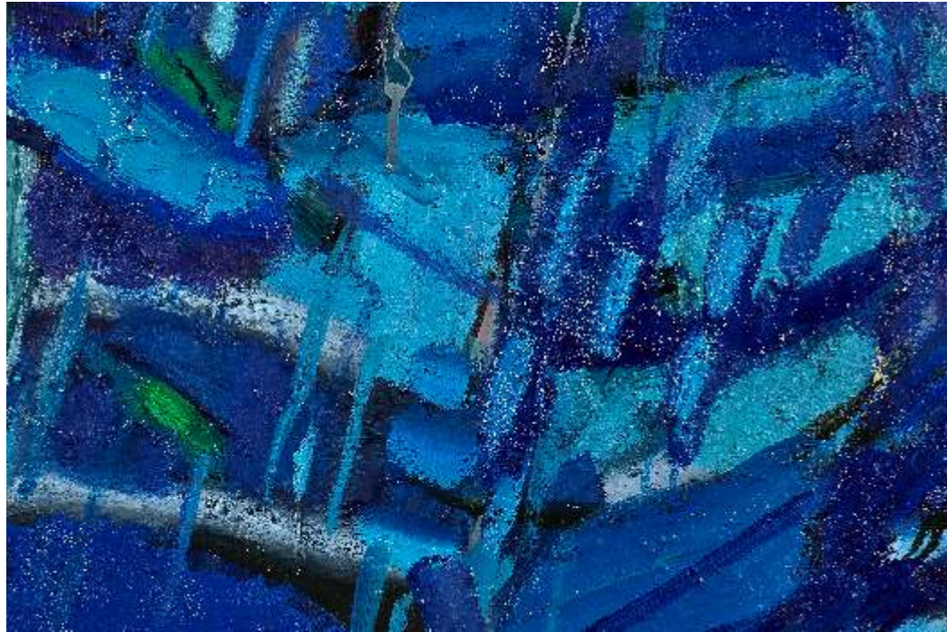
Błękitny rytm natury detal, olej płótno, 130 x 110cm, 2023