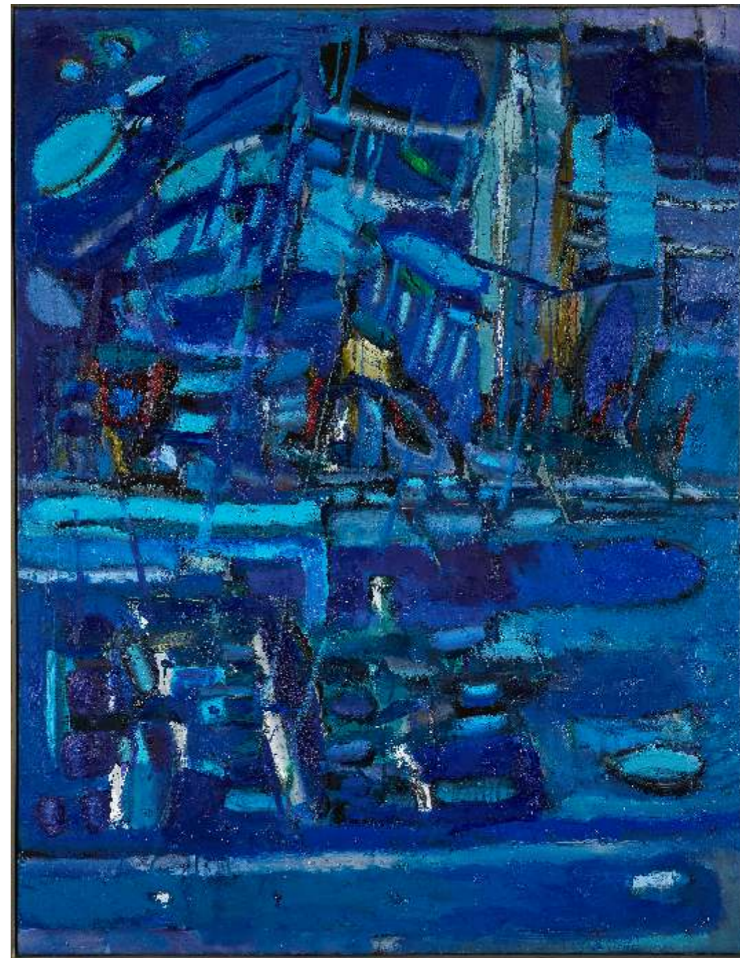
Błękitny rytm natury III, olej płótno, 130 x 110cm, 2022