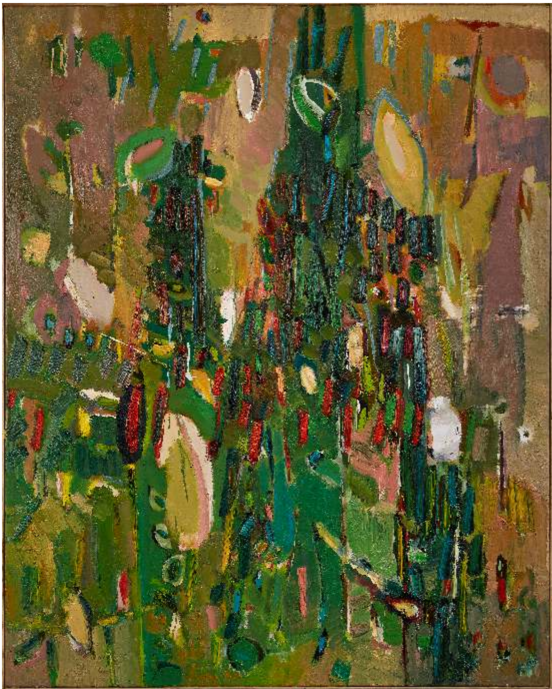
Common structure, olej płótno, 150 x 120cm, 2022