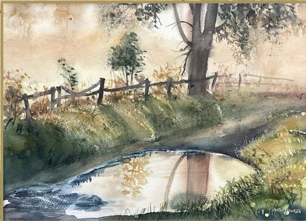
W lustrze wody