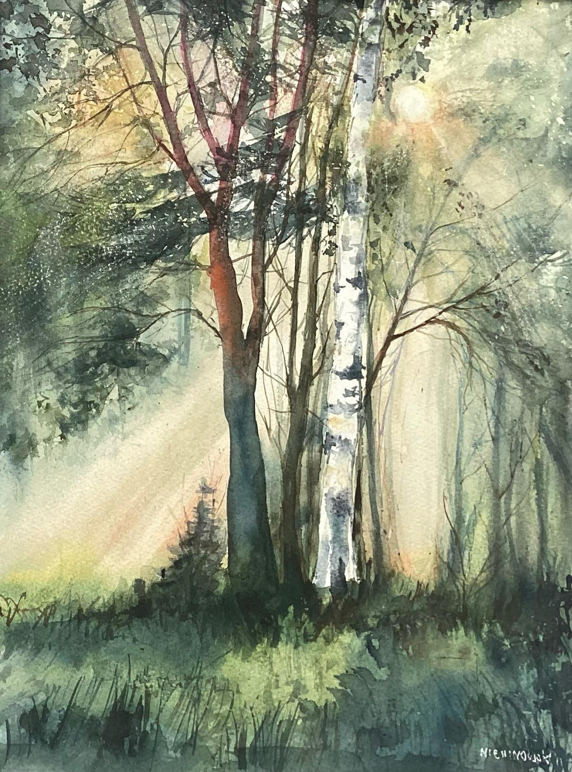
Słonecznie w lesie