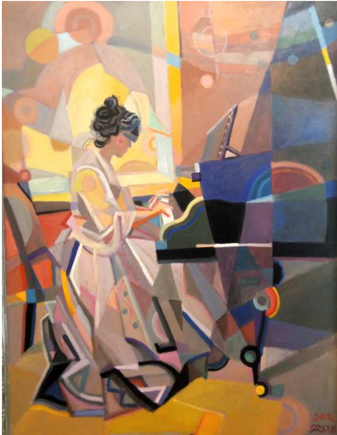
„Fortepian”, olej na płycie, 77 x 105 cm, 2022 r, Janusz Reszka