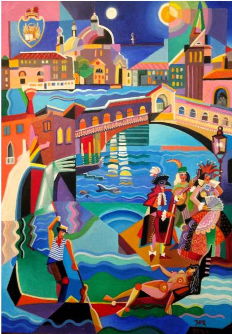
„Wenecja”, akryl na płótnie, 70 x 100 cm, 2020 r, Janusz Reszka