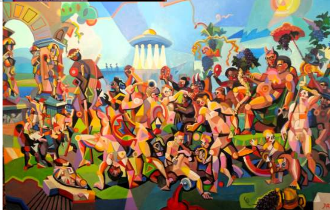
„Pochód Bachusa”, olej na płótnie, 180 x 120 cm, Janusz Reszka

„Miłość i Pasja” Janusz Andrzej Reszka, 50 lat pracy twórczej