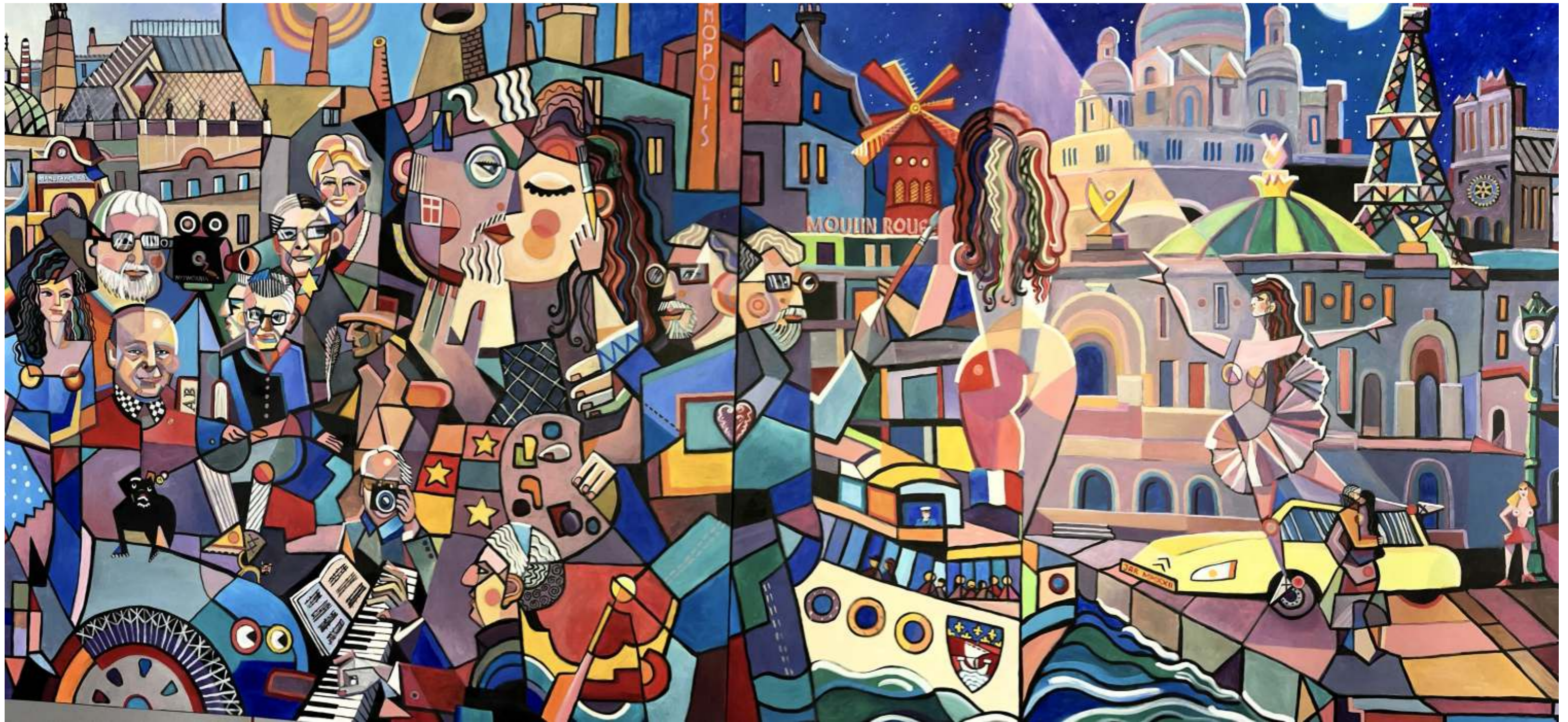
Dyptyk „Łódź Miasto Niezwykłe”, akryl na płótnie, 200 x 200 cm oraz 'Paryż mój drugi dom", akryl na płótnie, 200 x 200 cm, Janusz Reszka