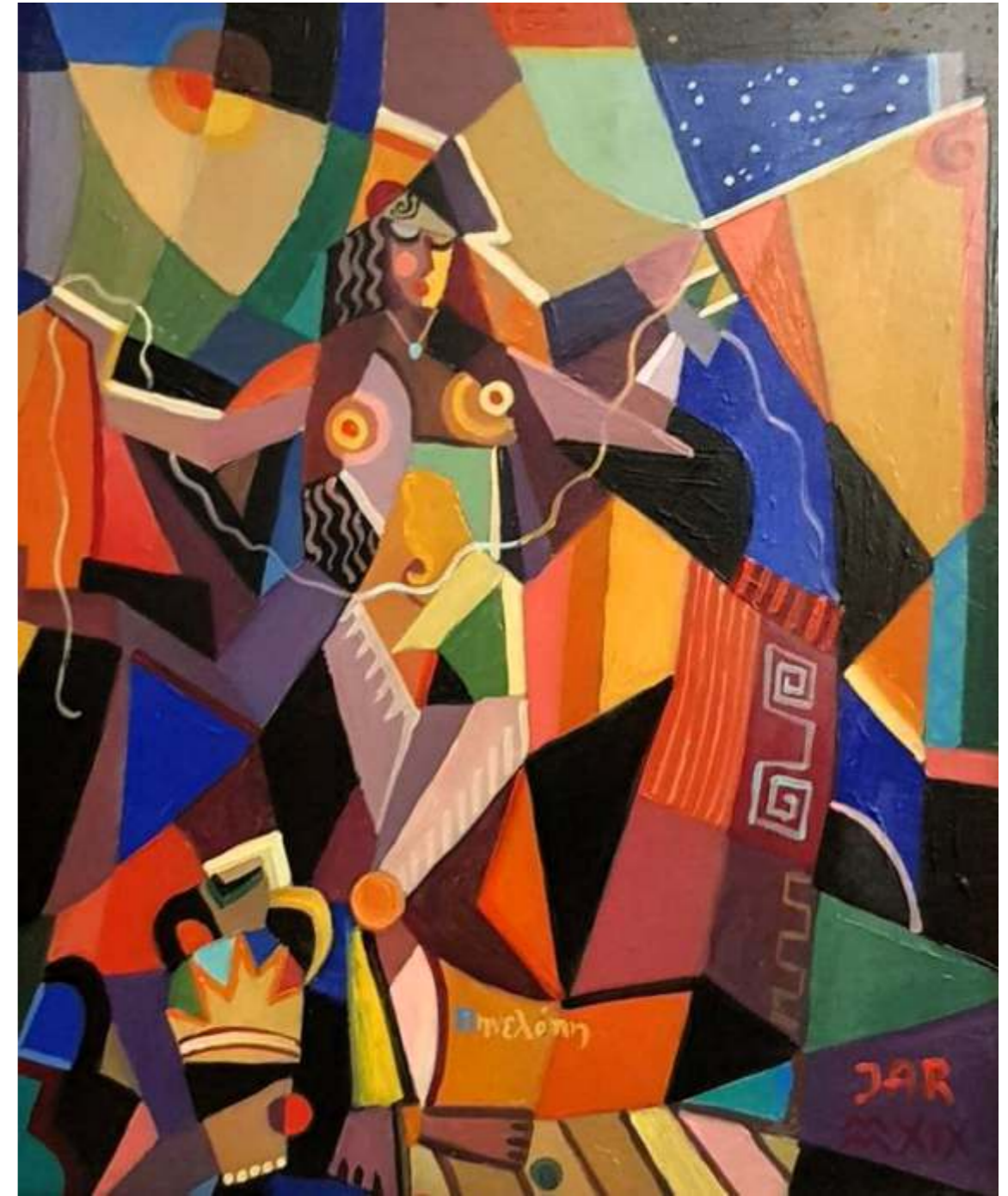
„Penelopa”, olej na płótnie, 80 x 100 cm, 2019 r, Janusz Reszka