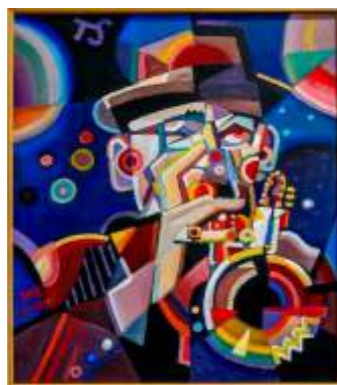
„T. Stańko”, olej na płótnie, 50 x 70 cm, 2025 r, Janusz Reszka

Projekt katalogu: dr Małgorzata Walaszczyk