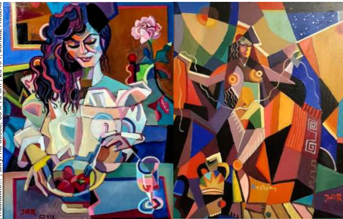
„Penelopa”, olej na płótnie, 80 x 100 cm, 2019 r, Janusz Reszka