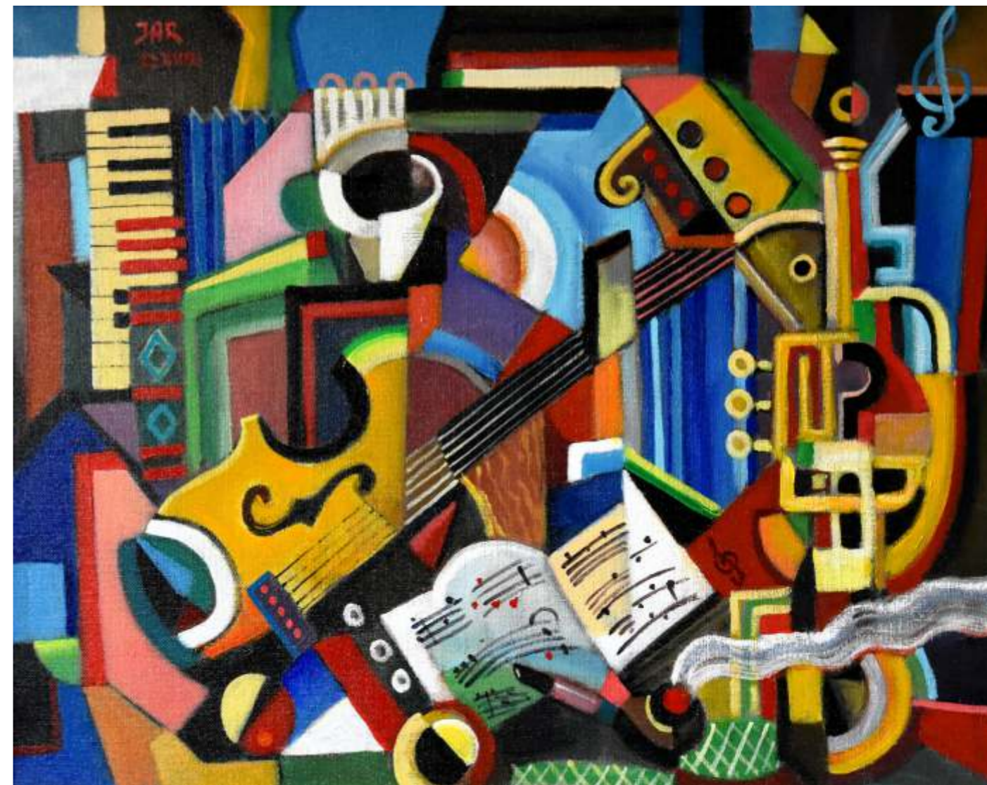
„Kompozycja Muzyczna”, olej na płótnie, 73 x 92 cm, 2018 r, Janusz Reszka