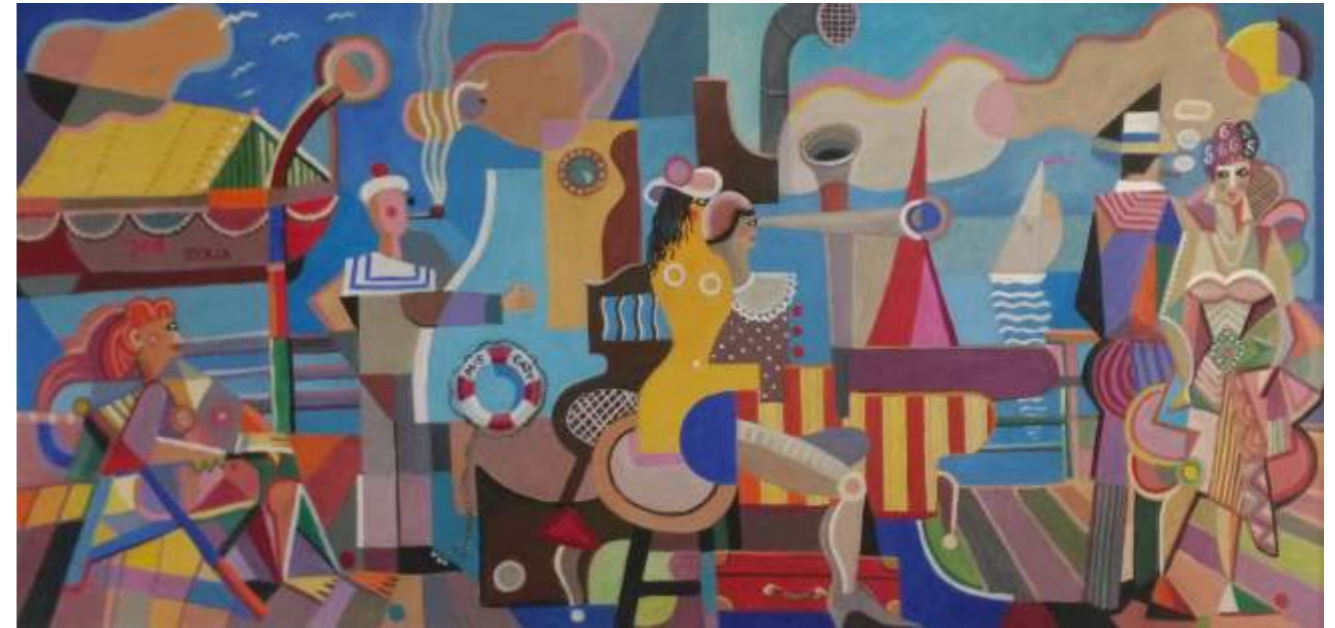
„Na pokładzie”, akryl na płycie, 140 x 70 cm, 2019 r, Janusz Reszka