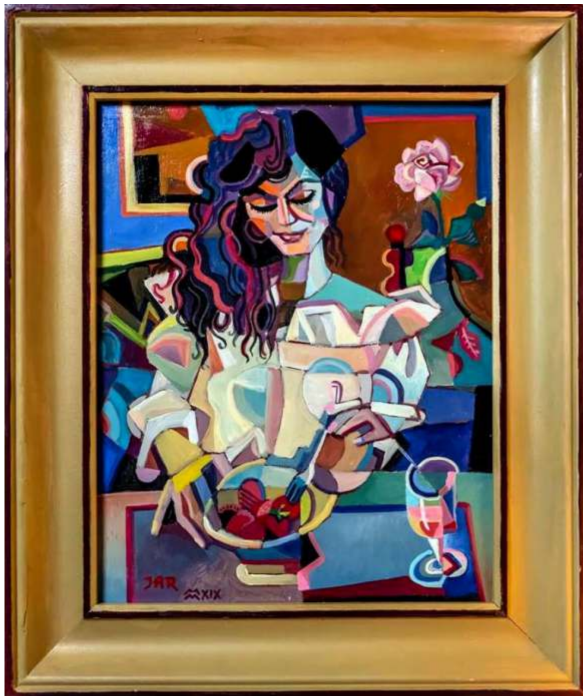
„Truskawki...”, akryl na desce, 55 x 70 cm , 2019 r, Janusz Reszka