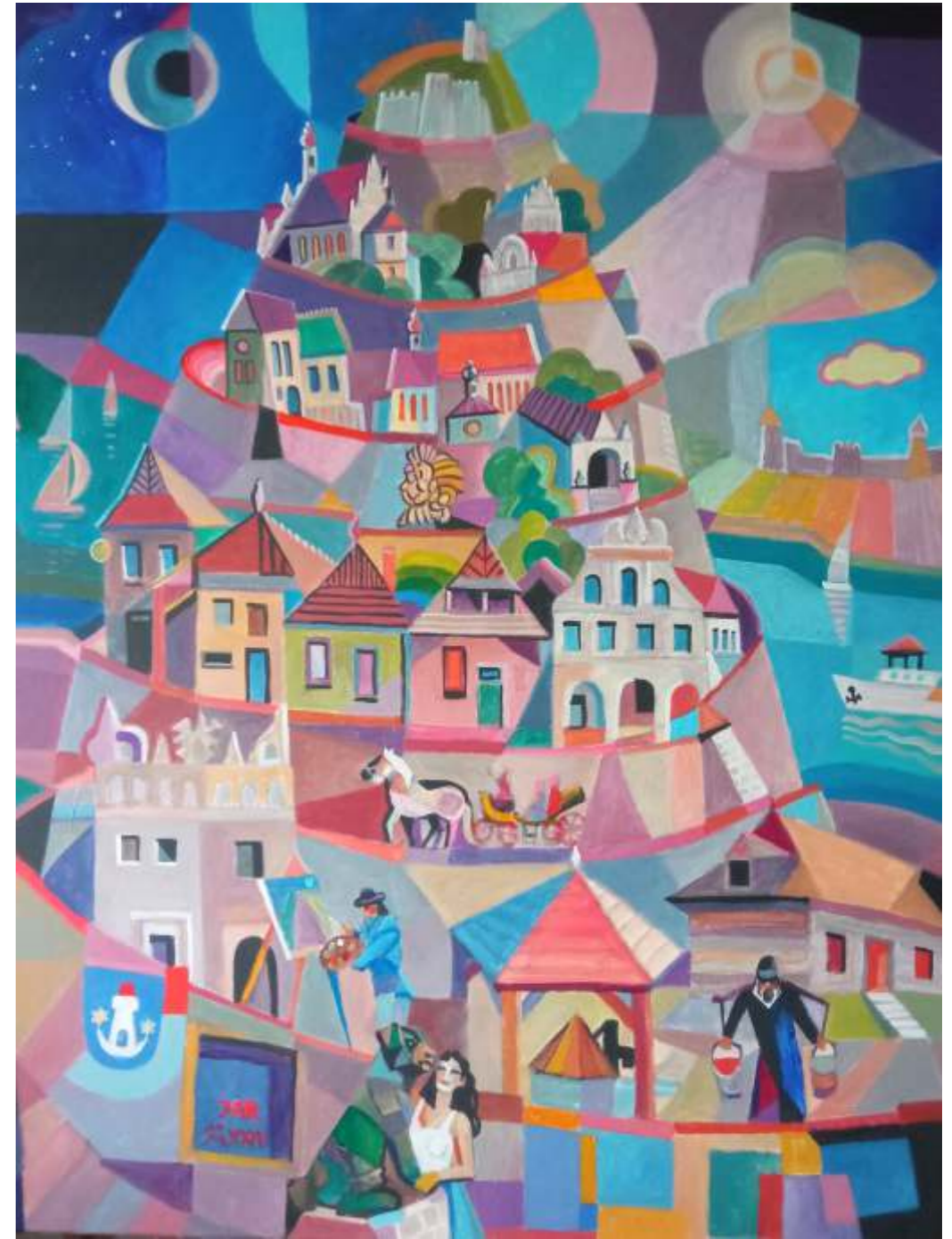
„Babel Kazimierski”, akryl na płótnie, 100 x 80cm, 2024 r, Janusz Reszka