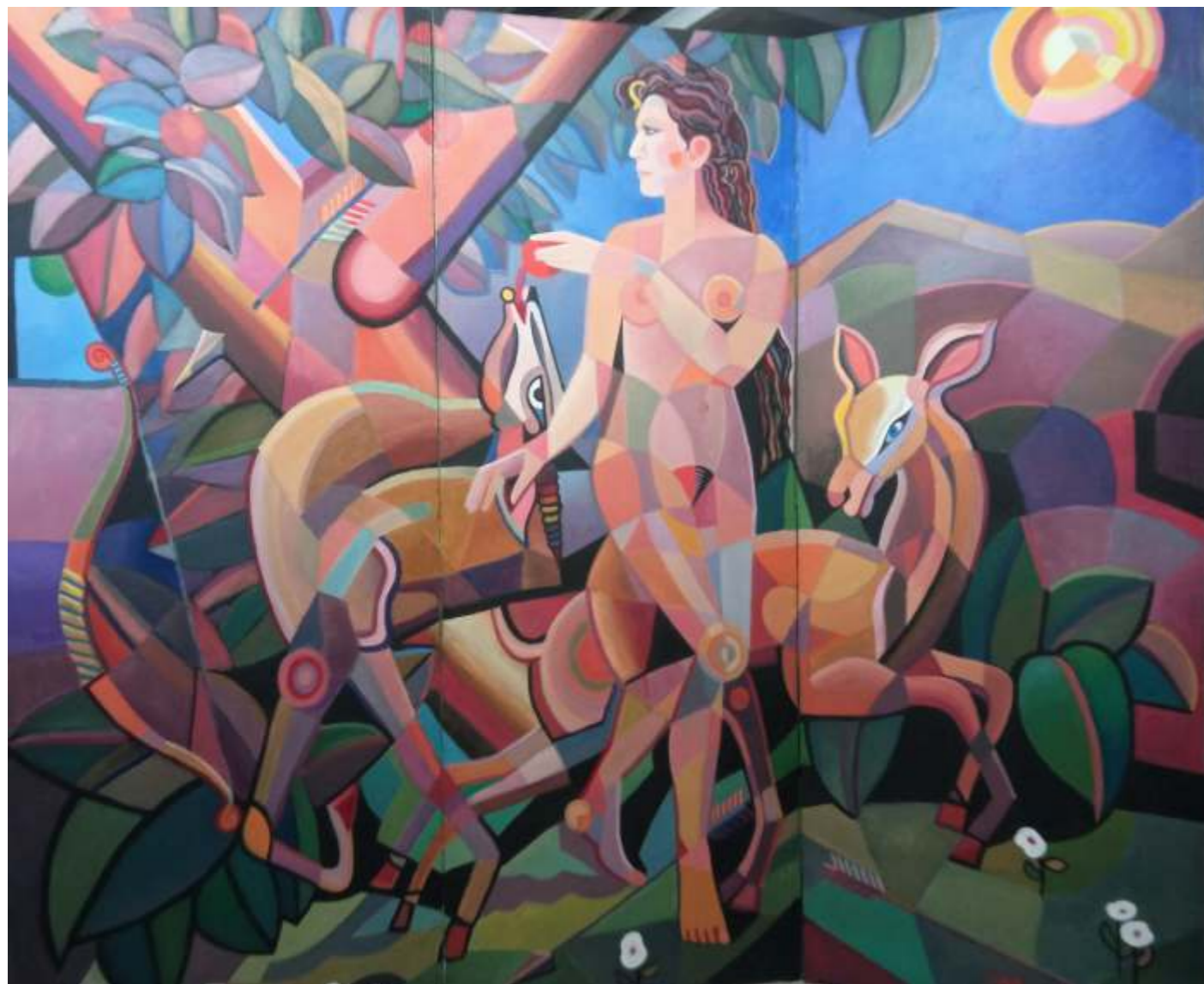
„Parawan Diana”, trzy panele, akryl na płótnie, 80 x 190, Janusz Reszka