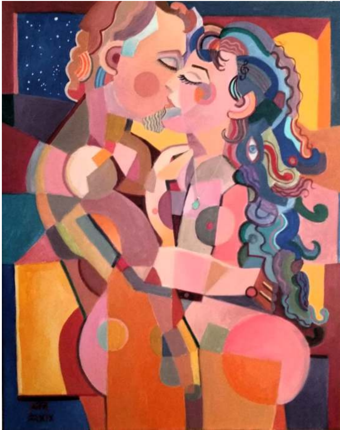
„Opal”, akryl na płótnie, 60 x 80 cm, 2019 r, Janusz Reszka