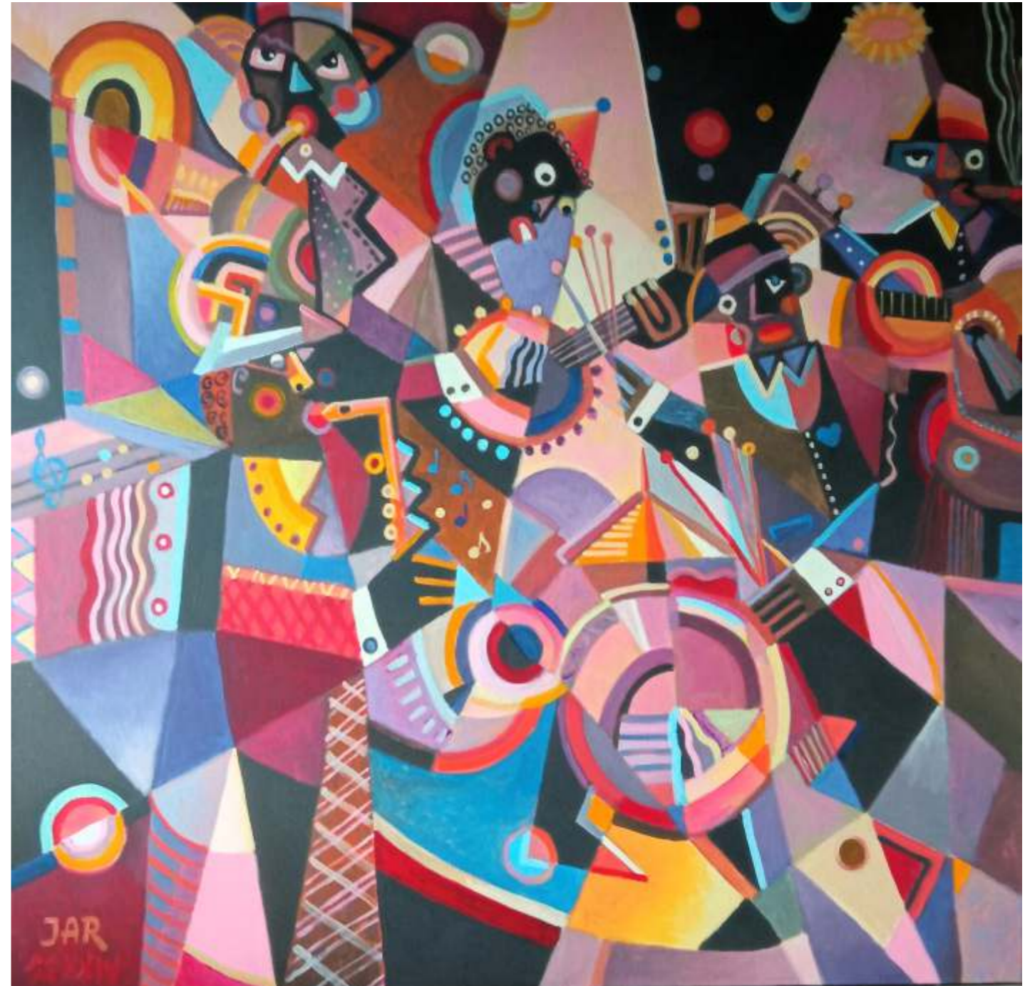
„Czarny Jazz”, akryl na płótnie, 100 x 100 cm, 2024 r, Janusz Reszka