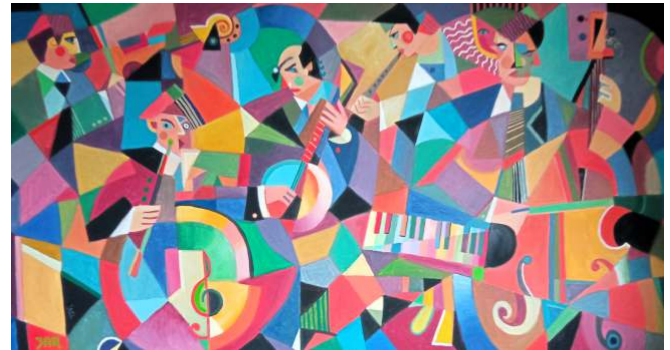
„Grand Jazz”, olej na płótnie, 100 x 180 cm, Janusz Reszka